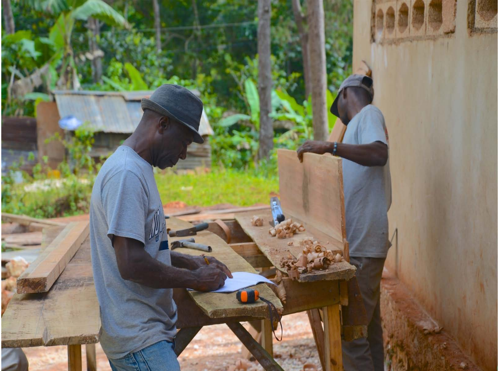
(Photo ci-dessus : Des artisans locaux appelés « boss maçons » sont chargés de la réalisation des travaux de réhabilitation des salles de classe.)

La présence des enfants en salle de classe a vite été compromise en raison des dégâts occasionnés par l'ouragan, la priorité pour les équipes du SIF fut de rétablir et d'améliorer au plus vite un environnement propice à l'acquisition du savoir.