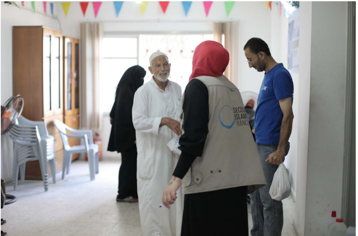
Les familles sont averties la veille par SMS ; les équipes s'assurent de sécuriser les lieux de distribution et que l'attente soit minimisée au maximum. Pour certains bénéficiaires, une remise à domicile est réalisée.