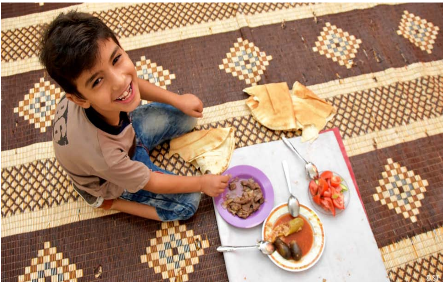
l'Aïd est souvent le seul moment de l'année où les bénéficiaires consomment de la viande. Votre geste leur évite l'angoisse d'avoir à dépenser de l'argent pour ce produit rare.