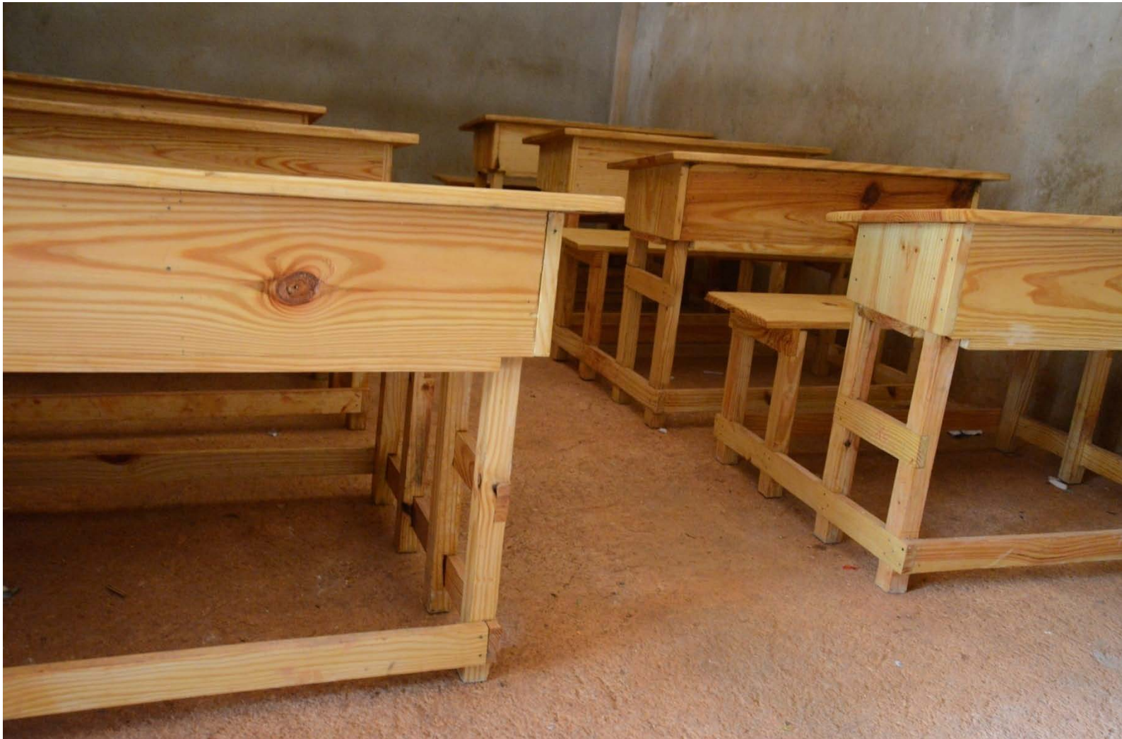
(Photo ci-dessus : Les salles réhabilitées, dépourvues de mobilier, sont également équipées de tables-bancs.)