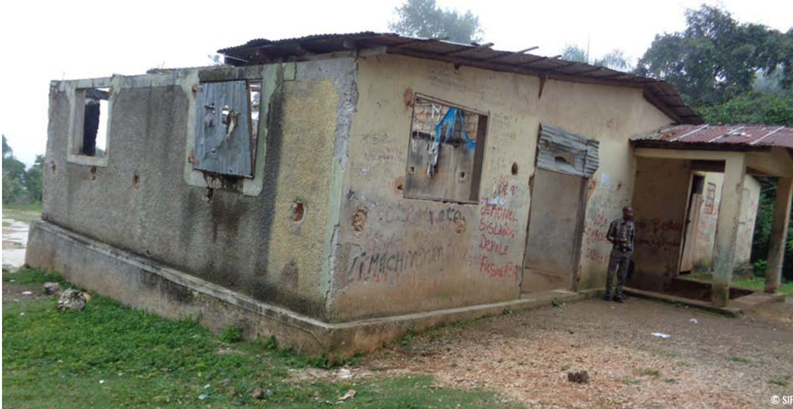
(Photo ci-dessus : De nombreux établissements très sérieusement endommagés : toitures arrachées partiellement ou en totalité)