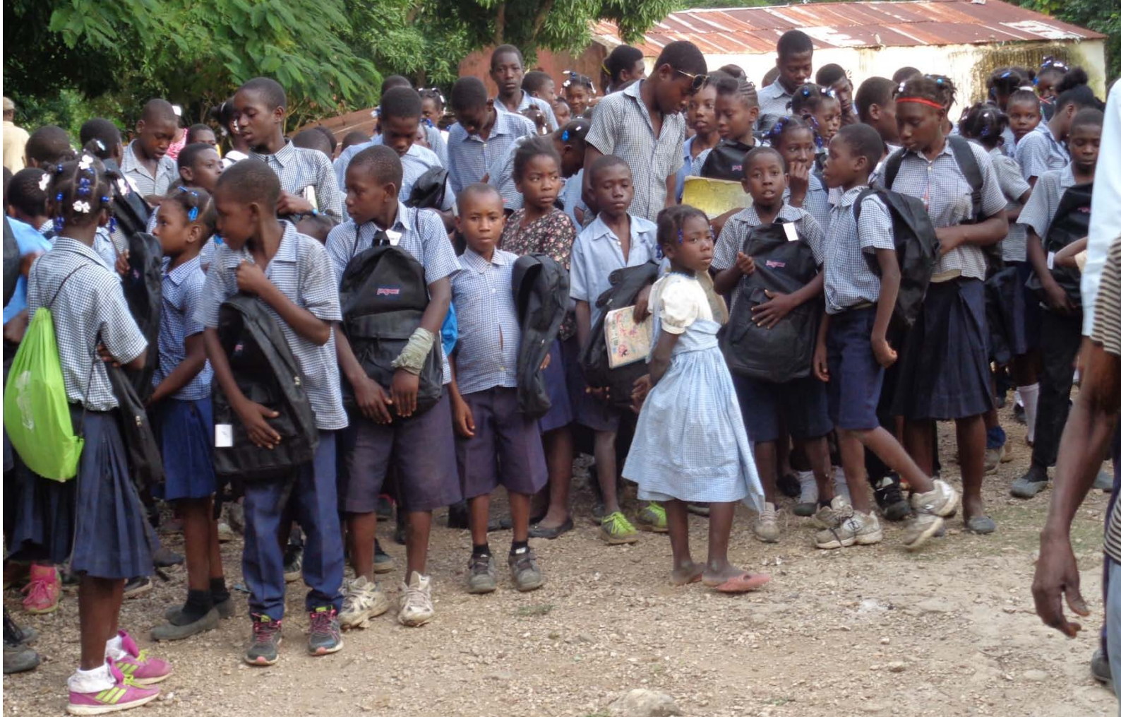
(Photo ci-dessus : Distribution des kits scolaires auprès des enfants (1 cartable contenant : 2 cahiers, 1 gomme, 2 crayons, 3 stylos, 1 règle, 1 paquet de crayons de couleurs, 1 taille crayon.)