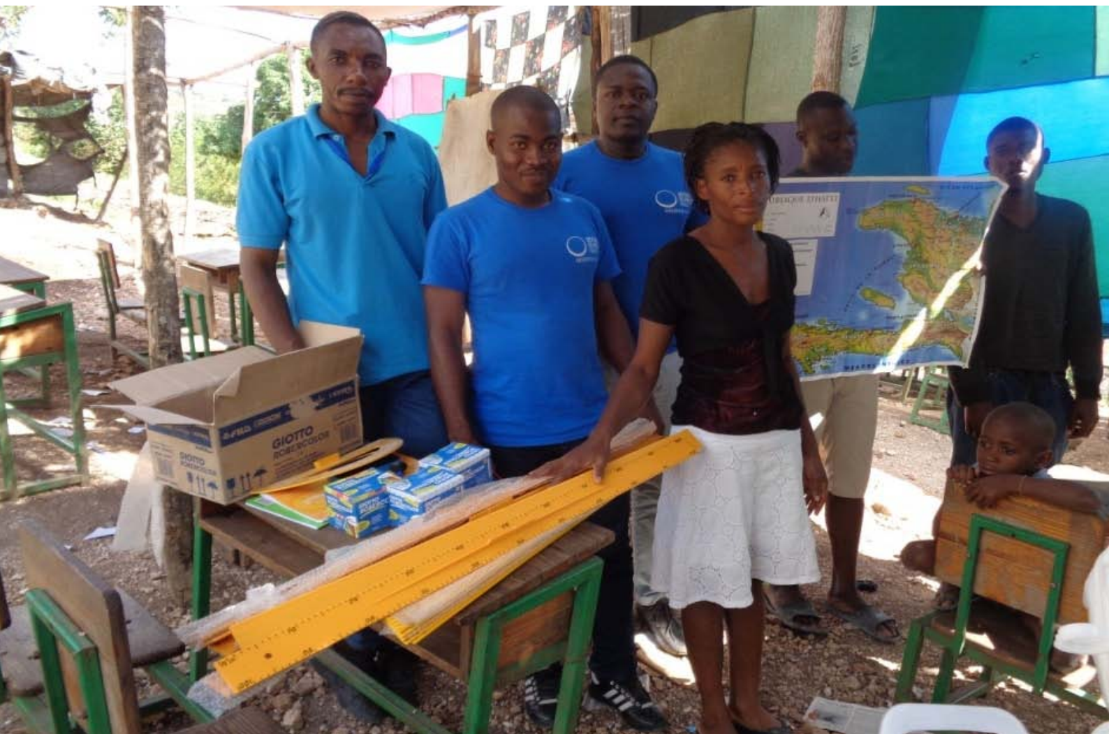
(Photo ci-dessus : Distribution des kits pédagogiques auprès des enseignants (1 carte du pays grand format, 1 grande règle, 1 grand compas, 2 grands cahiers, 2 boîtes de craies (blanches et couleurs)